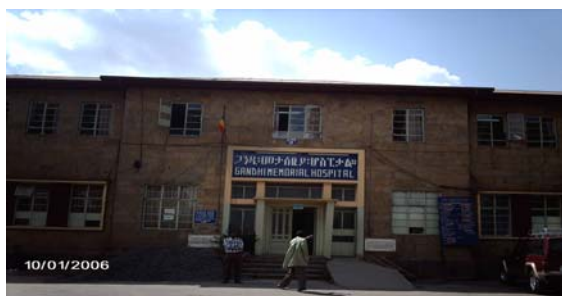
Gandhi Memorial Hospital