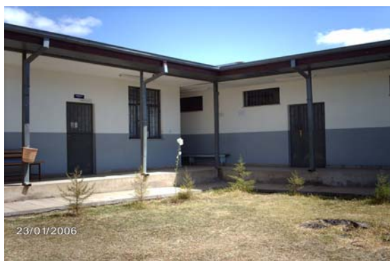
En del av byggnaderna på Sandafa Health Center