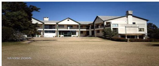
NML Guest House i Kasa Inches, Addis Abeba