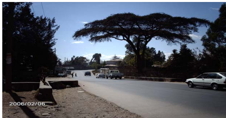
Kasa Inches, vägen förbi där vi bodde

Vi tycker man ska ta chansen att åka på utlandspraktik då det ger många upplevelser, vi fick en inblick i hur sjukvården fungerade samt se hur deras kultur är. Vi har många oförglömliga minnen med oss hem både positiva och negativa.