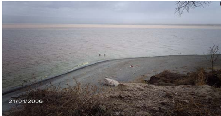
Vår egen strand i Lake Langano där vi bodde.