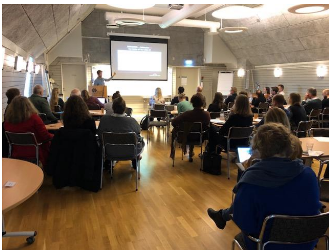
Figur 2. Workshop i Malmö den 7 november. Kommunförbundet Skåne samordnade workshopen tillsammans med projektgruppen för MuniComp. 42 personer deltog.

effekter. De första resultaten visar att förutsättningarna för att komma framåt i arbetet handlat om att det funnits politiska beslut och riktlinjer, stöd bland tjänstepersoner och samarbete mellan förvaltningarna, samt att man arbetat fram en modell för hur kommunen genomför sin bedömning. Ingen av kommunerna har kompensation som en egen kostnad i budget för exploateringsprojekt men även om det inte finns budgeterade transaktionskostnader innebär arbetstiden en kostnad som kommunen väljer att ta.