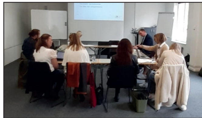
Samordningsgruppens kickoff i Hässleholm

Den 6 maj hade Samordningsgruppen en kickoff på Hotell Statt i Hässleholm. Det var mycket givande diskussioner om forskningsplattformen och framtiden och idéer för samverkan och kunskapsspridning. Bland annat diskuterades hur man i samverkan kan utveckla ”den lärande organisationen”. En diskussion fördes även om att anordna en 20-års jubileumskonferens 2023 med fokus på hälsofrämjande hälso- och sjukvård samt vård och omsorg.