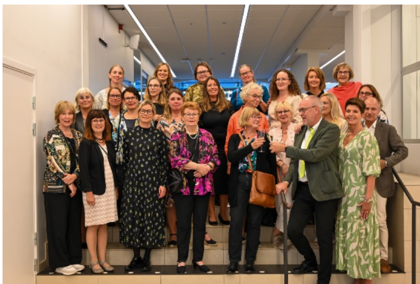
Firande av forskningsplattformens 20-årsjubileum på Kulturkvarteret i Kristianstad.