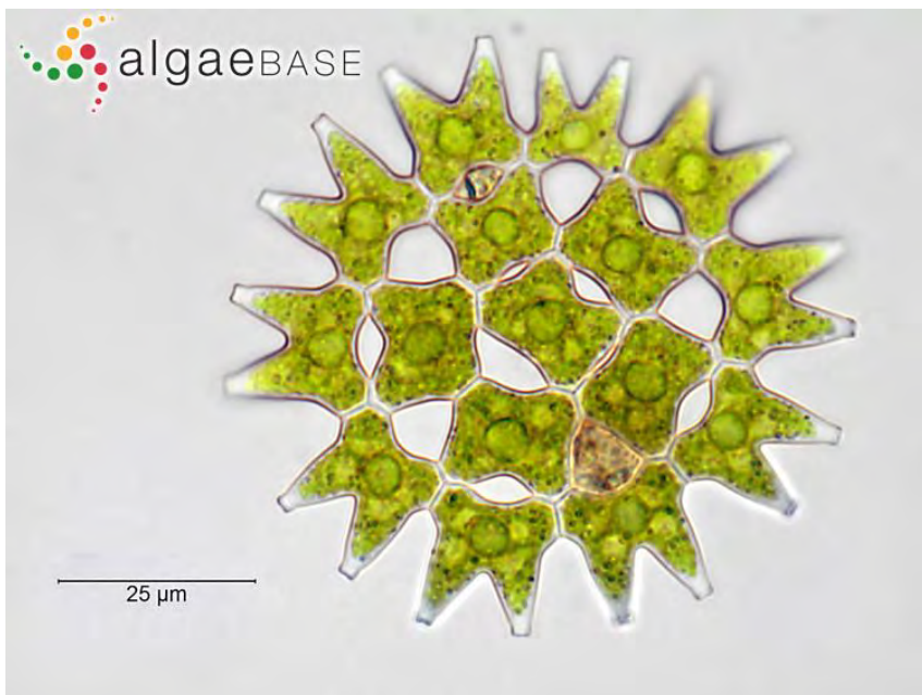
Figur 4. Pediastrum duplex ( https://alchetron.com/Pediastrum-duplex )

Resultat och diskussion: Vattnet såg ut som att det pågick en kraftig algblooming, vilket gjorde att fem drag med håven gav tillräckligt med material för att studera algsammansättningen. Vid undersökningen i mikroskopet visade det sig att det inte var en enhetlig algblooming, utan ett tydligt eutrofierat vattenprov, typiskt för denna tid på året med samtidigt högt antal olika fyla av växtplankton. Dominerade gjorde grönalger, kiselalger och cyanobakterier, men det förekom även en hel del dinoflagellater, bl.a. Peridinium spp, Gonyaulax sp, och Proto-peridinium spp. Totalt identifierades 25 växtplankton till art och ytterligare 11 till släkte. Fynden av alger stärker bilden av en eutrofierad sjö, där speciellt Scenedesmus quadricauda (en kiselalg), Microcystis sp. och Phormidium contorta (en cyanobakterie) samt Euglena sp. (euglenoider) är starkt förknippade med övergödda vatten med mycket organiskt material. I övrigt kan nämnas att vi såg sex olika arter av Pediastrum (ett grönalgssläkte).