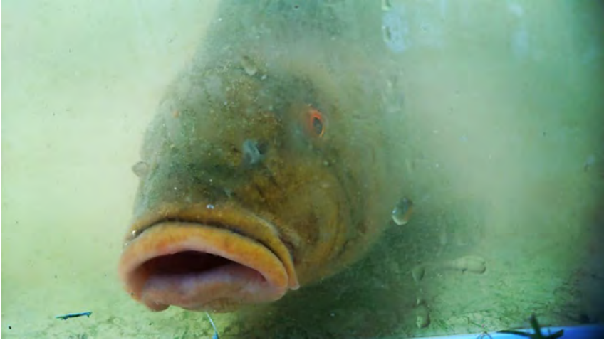
Figur 1. Närbild på sutare fångad i provfiske nätet under Bioblitz