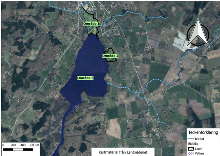
Figur 2: Studieområdena för bioblitz i Arkelstorp, på land markerat med grönt och på vattnet med blått.

sjön. Område 2 är en betesmark som ligger strax sydost om samhället, i anslutning till båtklubben och sjöns östra strand. Det tredje området är själva viken, vattenspegeln som avgränsas i söder med en trång passage till övriga delar av Oppmannasjön.