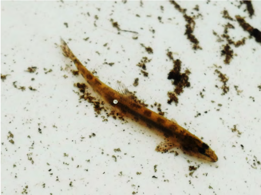
Figur 4: Nissöga

Även andra fiskar som ej fångades kan förväntas finnas i sjön, så som Ål och Flodnejonöga. Även Öring skall vara närvarande i bäckarna som leder till sjön, men vad som händer med den populationen efter förra årets torka är osäkert. Trots försök fångades alltså inga öringar under Bioblitz. Sammanfattningsvis är fiskesamhället i en bättre status än förväntat.