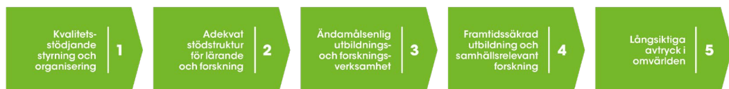
Figur 2. Höskolans fem kvalitetsmål.

Höskolans fem kvalitetsmål (figur 2) är vägledande för kvalitetsarbetet och ska verka både stödande och som målbilder. Kvalitetsmålen ligger i linje med strategins fyra vägledande principer: högskolan ska vara attraktiv, vara sammanhängande, präglas av nytänkande samt vara regionalt relevant.