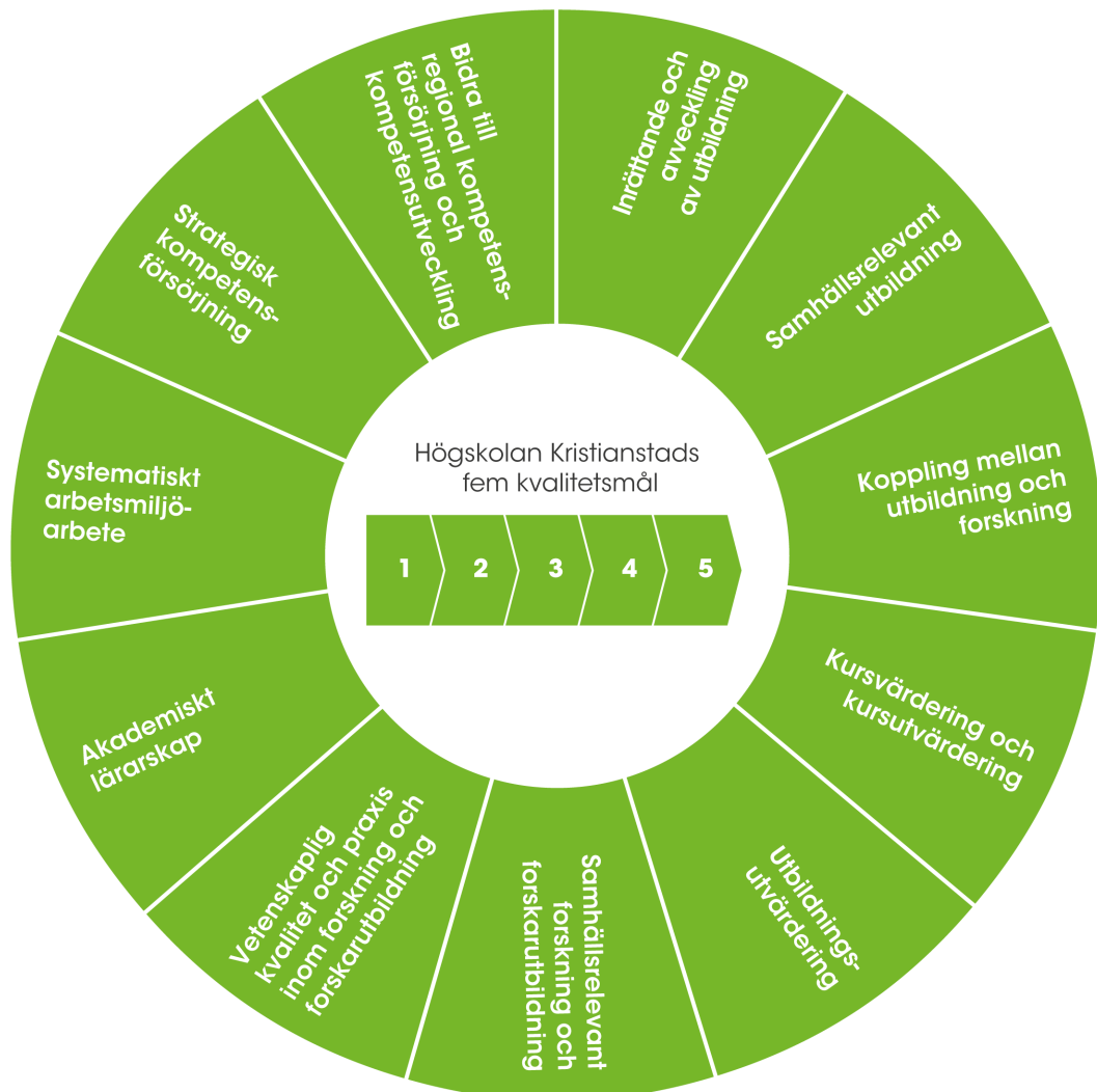
Figur 3. Aktivitetsområden inom högskolans kvalitetssystem.

processer som identifierats som väsentliga för högskolans kvalitetsarbete och fortsatta utveckling (figur 3). Ett aktivitetsområde innehåller aspekter av både kvalitetssäkring och kvalitetsutveckling och bidrar till att uppnå ett eller flera kvalitetsmål.